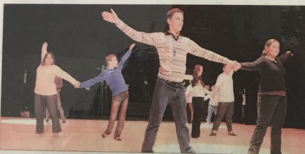
Parmi les vingt tableaux présentés, on pourra voir celui des danseurs de l'IME de Crèvecœur.

► Festival Handidanse, à 14 heures, au théâtre de Cambrai. Tarif unique : 5 €. Places en vente le jour même. Réservations pour les personnes à mobilité réduite : ☎ 03 27 76 59 18 ou ☎ 06 63 79 30 76.