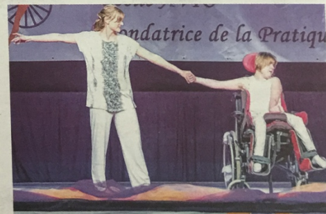
Dix-neuf chorégraphies ont été proposées hier. Il y en aura au total plus d'une centaine, que le public est invité à venir voir.