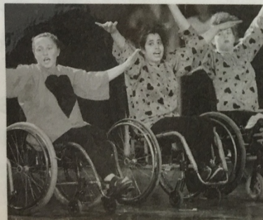
Dans leur fauteuil roulant, les adolescentes handicapées exécutent une chorégraphie.