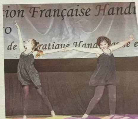
L'an passé, ces deux jeunes femmes venues d'Isère avaient remporté le « coup de cœur national handidanse ». Elle ont eu le privilège d'ouvrir le concours 2015.