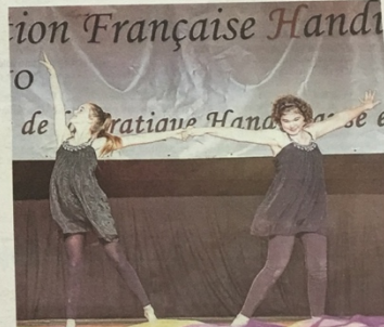
L'an passé, ces deux jeunes femmes venues d'Isère avaient remporté le « coup de cœur national handidanse ». Elle ont eu le privilège d'ouvrir le concours 2015.