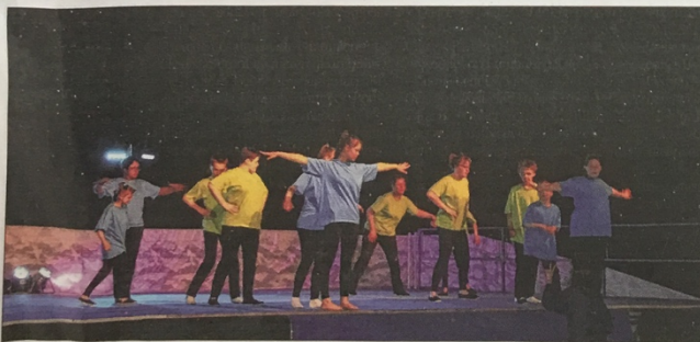
Difficile de distinguer un handidanseur d'un danseur de modern jazz valide...

► Toute personne intéressée par la handidanse (pratique, formation...) est invitée à se manifester en téléphonant au 03 27 76 59 18.