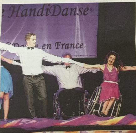
Quel que soient leurs handicaps, tous les artistes ont donné le meilleur d'eux-mêmes.

Près de 800 danseurs auront convergé, mercredi soir, vers le palais des Grottes de Cambrai pour concourir.