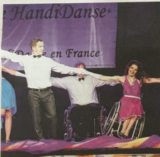
Quel que soient leurs handicaps, tous les artistes ont donné le meilleur d'eux-mêmes.