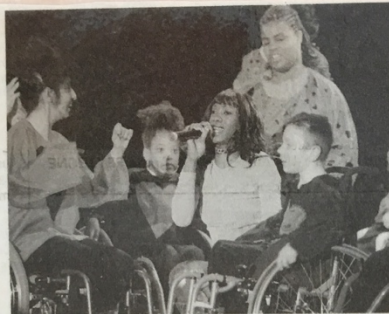
Lady, dont le single « Easy love » est actuellement un tube chez les adolescents, chante entourée des handicapés sur la scène du C.C.A.M.

Dimanche, au Centre de Congrès Auditorium de Monaco, les handicapés de la fondation H.E.L.P. ont prouvé que la trisomie, la paralysie, la surdité ou la cécité ne sont pas des handicaps à la danse !