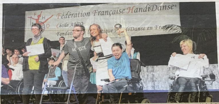
Premières récompenses ce lundi midi et premières explosions de joie chez les danseurs... Cette année, ce sont 154 chorégraphies qui vont être évaluées au palais des Grottes.

66 Au cours de ces trois jours, les handidanseurs vont présenter plus de 150 chorégraphies.