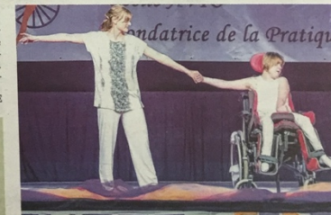
Dix-neuf chorégraphies ont été proposées hier. Il y en aura au total plus d'une centaine, que le public est invité à venir voir.