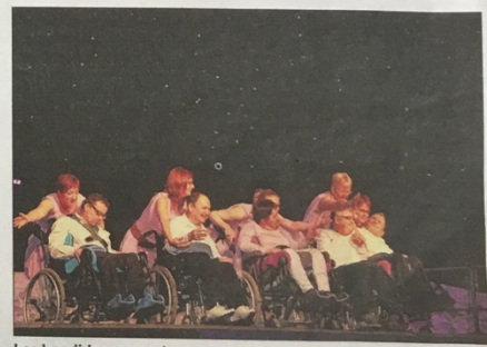
Les handidanseurs n'ont pas oublié que leur art rime souvent avec humour et autodérision.