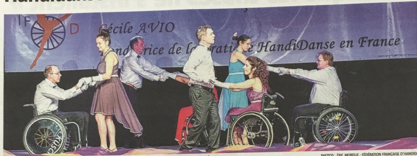
Près de 800 danseurs auront convergé, mercredi soir, vers le palais des Grottes de Cambrai pour concourir.

Depuis hier midi et jusqu'à demain soir, des « handidanseurs » de toute la France s'expriment sur la scène du palais des Grottes de Cambrai, dans le cadre du concours organisé par leur fédération. Un très beau rendez-vous artistique annuel.